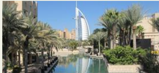
de skyline van Dubai

Offshore sourcing kan ook een strategisch voordeel bieden: het kan de export doen bevorderen. Voor veel Nederlandse ICT-bedrijven liggen er uitstekende kansen in het Golfgebied, zoals in Saudi-Arabië of in Dubai. Deze landen hebben de economische recessie reeds achter zich gelaten, en er wordt zwaar geïnvesteerd. De schatting is dat er alleen al in de laatste jaren voor 180 miljard dollar aan ICT investeringen hebben plaatsgevonden. De vraag naar westerse technologie, producten en creativiteit is er groot.