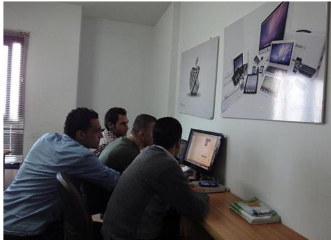
een offshore team

In de opstartfase kunnen persoonlijke ontmoetingen tussen de aanspreekpunten noodzakelijk zijn; de betrokkenen moeten elkaar goed leren kennen. Ook tijdens de uitvoering van de dienstverlening blijven periodieke gezamenlijke vergaderingen noodzakelijk. Agile ontwikkeling met intensieve en frequente online communicatie met het Nederlandse team behoort nu tot de mogelijkheden en verschillende buitenlandse dienstverleners hebben hier uitgebreide ervaring mee opgedaan.