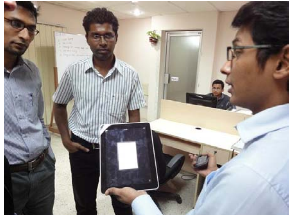
Dhaka: ontwikkelaars van iPad applicaties