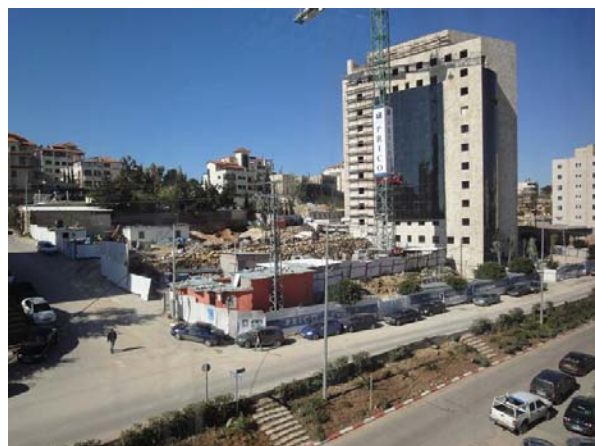
Ramallah: bouw nieuw (IT)-kantoorgebouw