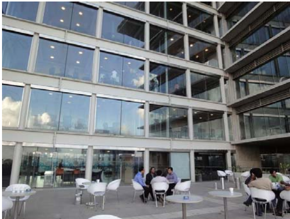
Nieuw kantoor IT-bedrijf Dhaka (Bangladesh)