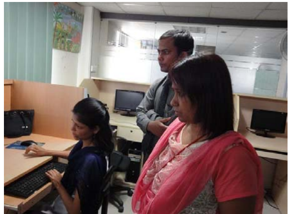
Dhaka: dienstverlening op grafisch gebied