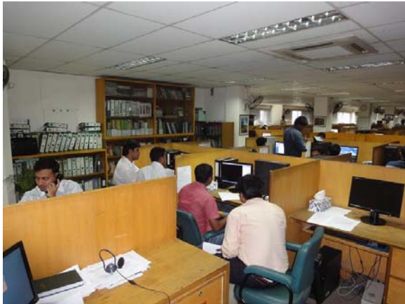
Dhaka: software ontwikkelaars