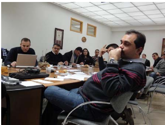
Ramallah (Palestina): IT-training