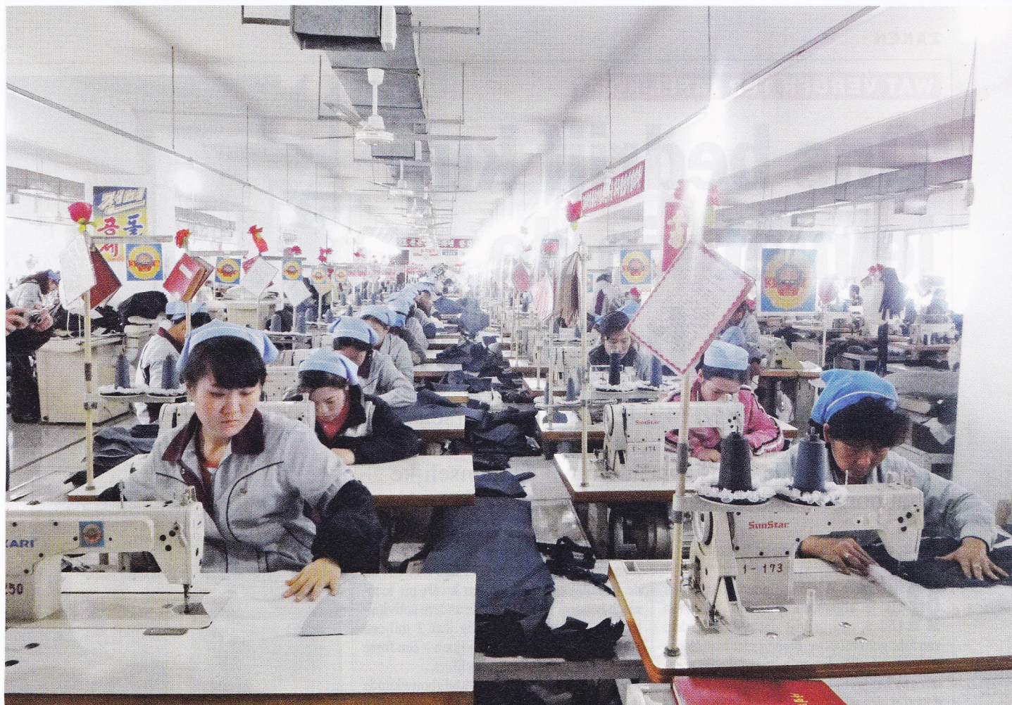
Veel westerse bedrijven laten kleding maken in Noord-Korea. Werknemers zijn er goedkoper dan in China, fabrieken zijn efficiënt, ruim en schoon

handelsboycot. Maar het regime bleef zitten en de levensomstandigheden van het volk werden slechter. Als een land besluit zich open te stellen, moet je daarop ingaan.'