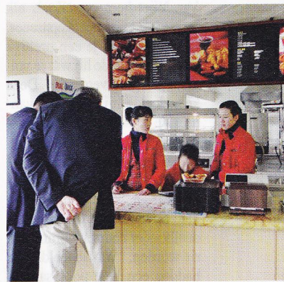
Sinds kort is er ook fastfood in Pyongyang

Zakendoen in Noord-Korea ligt dus erg gevoelig in Europa en Amerika, dat een streng handelsverbod handhaaft. Daarbuiten lijkt het taboe minder groot. Niet alleen China drijft op grote schaal handel met het land, ook de Egyptenaren zijn er erg actief, evenals